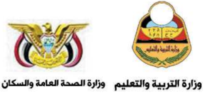
وزارة التربية والتعليم وزارة الصحة العامة والسكان

We managed to orchestrate the symphony of giving and developing within a year full of well-coordinated activities in the arena of health, education, and capacity building. We are so grateful to all of our partners. We long for a continuation of this great partnership to augment work between civil organizations.