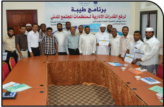
Taybah Program 3 to Qualify Civil Society Organizations Leadership with 30 Participants, September, 2014