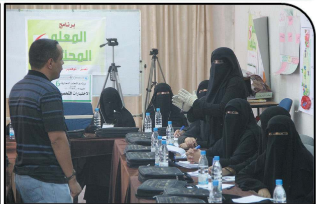
The Sixth Professional Instructor Program with 37 participants in Taiz in December, 2014