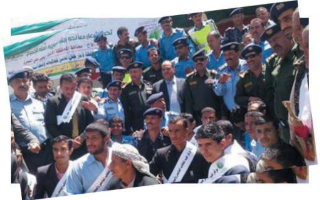
المشاركة في اسبوع المرور العربي