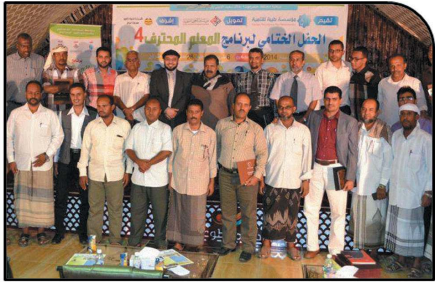
The Fourth Professional Instructor Program with 40 participants in Al Mukala in January, 2014