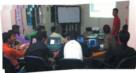
دورات الحاسوب المتخصصة