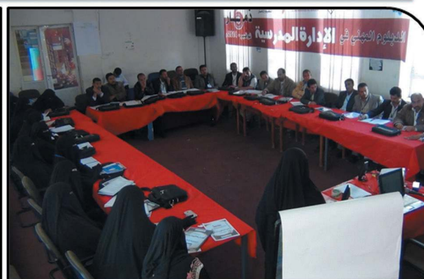
The Sixth School Management Professional Diploma with 30 participants - Dhamar- November, 2014