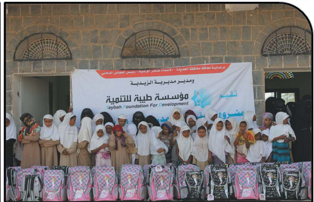
School Bag Campaign with 750 beneficiaries Al Hodidah, November, 2014