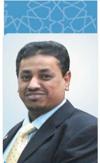
أ. صالح باقلاقل رئيس مجلس الأمانة

نتمنى أن تُسهّم هذه الجائزة في تعزيز الشراكة الحقيقيّة بيننا وبين جميع المهتمين بإحداث نقلة نوعيّة في مجالي الصحة والتعليم داخل وطننا الحبيب .. لأنه أحوج ما يكون لدورنا الرائد في التخفيف من أعباء مشاكله وخصوصاً في المرحلة القادمة التي تتطلّب من الجميع أن يبذل جهداً مُضاعفاً لتحقيق تنمية مُستدامة ترتكز على الإنسان وإمكانيّاته الهائلة ..