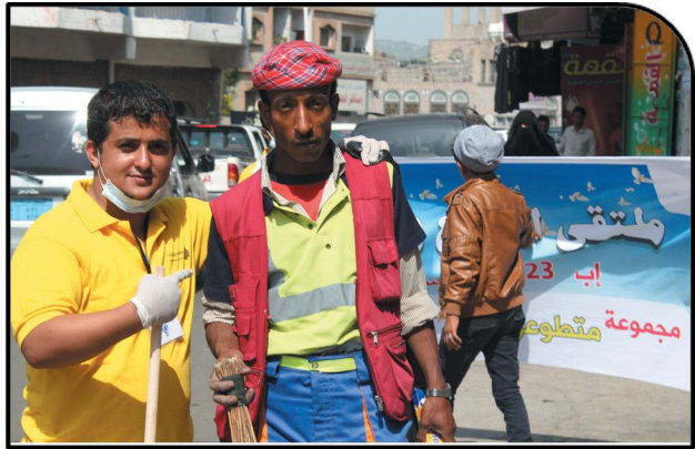
Creativity and Distinction Forum 5 with 175 participants - Tibah centers- August, 2014