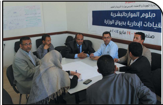
Human Resources Program for Ministry of Education Employees with 33 Participants, May 2014