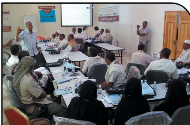
The Fourth School Management Professional Diploma with 30 participants - Sayaon- October, 2014