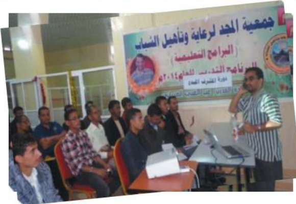
دورات تأهيل وبناء القدرات