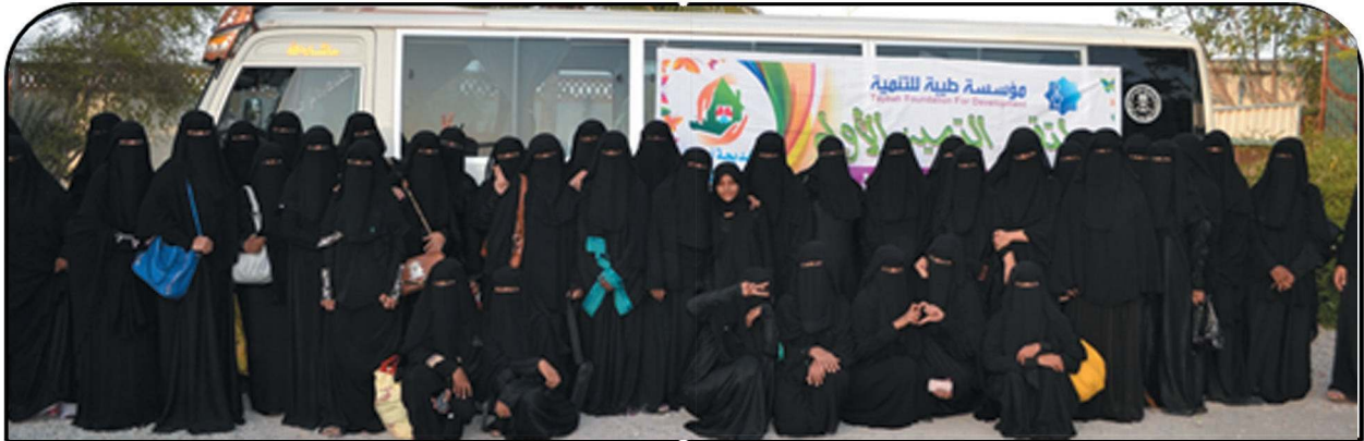
Distinction Forum for Hadhramout University Female Students with 80 participants-Hadhramout, September 2014