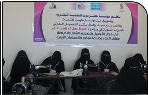
Work Life Program with 158 Participants, September 2014