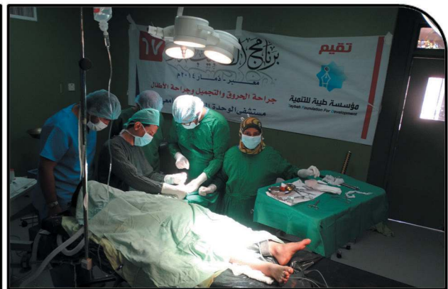
The 2014 Visiting Doctor Stage 13 with 463 Operations