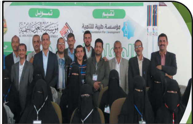
The Fifth Professional Instructor Program with 35 participants in Hajja in December, 2014