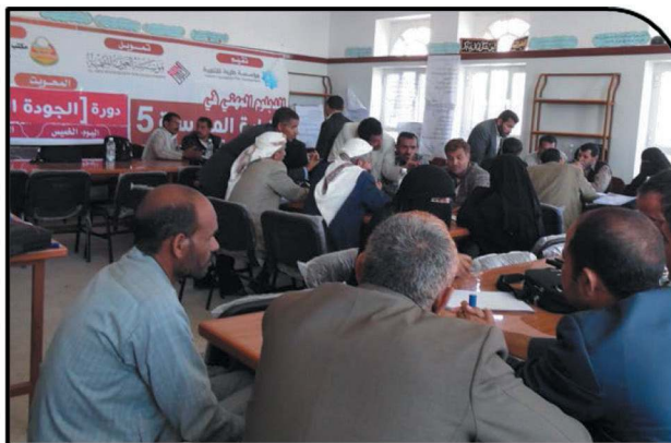
The Fifth School Management Professional Diploma with 30 participants – Al Mahweet- December, 2014