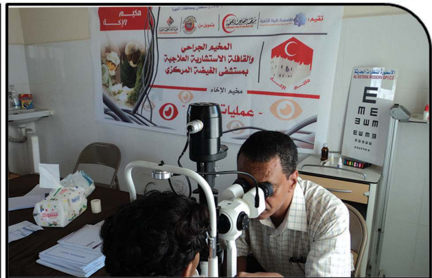
The 2014 Taybah Surgical Camps in Lahj (181 Operations) and Al Mahra (295 Operations)